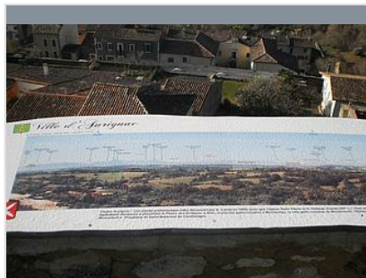
TABLE D'ORIENTATION DU DONJON

Activité encadrée par un professionnel diplômé